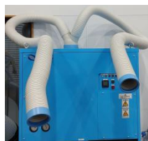
オプション2又吹出口