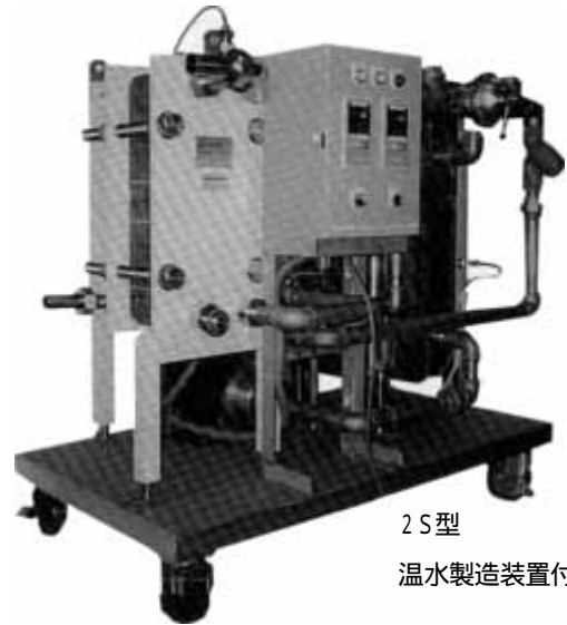
2S型 温水製造装置付