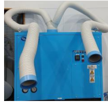
オプション2 又吹出口