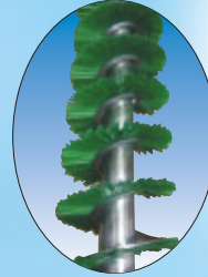
スパイラルブラシ